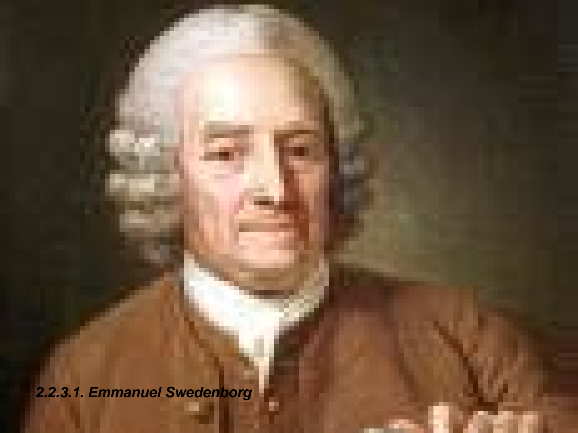
2.2.3.1. Emmanuel Swedenborg